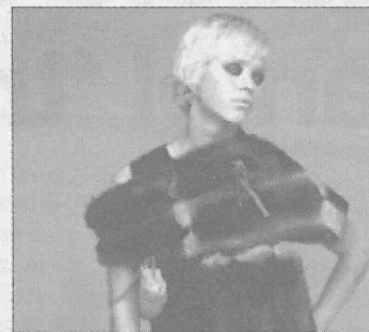
►► Una estola de Moschino.

Todo vale en la moda de este invierno. Resucitan las hombreras de los años 40 y 80; las prendas bordadas de los 30, e incluso las estolas que ampararon la imagen femenina de los años 20. Se trata de un complemento muy refinado, realizado en piel